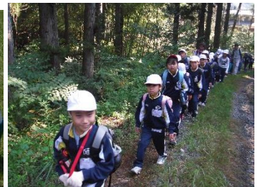
開校記念登山 薬師山