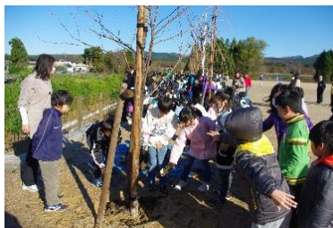
グラウンド完成記念植樹