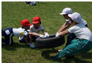
第1回運動会 タイヤ引き