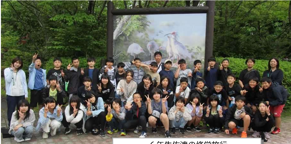
～6年生佐渡の修学旅行～